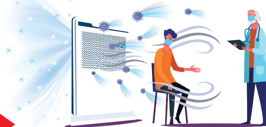
ウイルスガードウォール